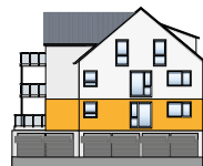
Süd-Ost Ansicht EG | Wohnung 1