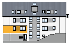
Nord-Ost Ansicht EG | Wohnung 1