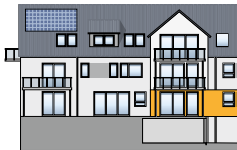
Süd-West Ansicht EG | Wohnung 1