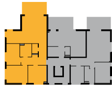
Draufsicht EG | Wohnung 1